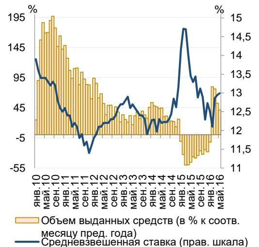
Темпы роста объемов выдачи рублевых ипотечных кредитов и средний уровень процентных ставок в 2010-2016 гг.