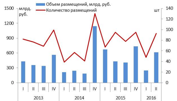
Объем размещения рублевых корпоративных облигаций и динамика индекса «IFX-Cbonds-срвзв. доходность (эфф.)»

Между тем, улучшение показателей предоставления кредитов происходит на фоне роста просроченной задолженности – по состоянию на 1 июня 2016 г. объем просроченной задолженности по ипотечным кредитам вырос на 35,8% в годовом выражении (и на 15,3% в месячном) и составил 253,3 млрд. руб. (6,1% всего ипотечного портфеля). Главным образом, рост задолженности наблюдается по платежам, просроченным до 30 дней (61,9% в годовом выражении) и свыше 180 дней (55,0%).