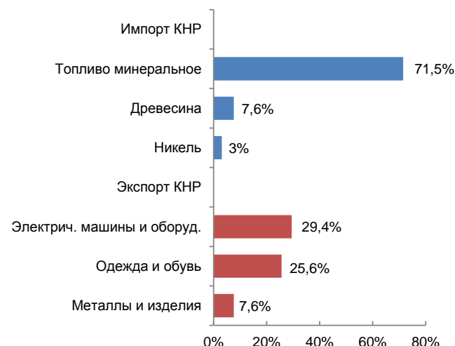
Рисунок 2. Основные товары экспорта и импорта КНР во внешней торговле с РФ в 2014 г.