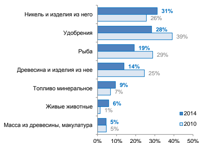
Рисунок 3. Доля поставок из РФ в импорте КНР, % от общего объема импорта соотв. товара