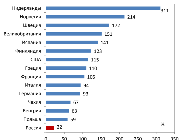
Рисунок 1. Задолженность населения по кредитам в 2012 г., в % к располагаемым доходам