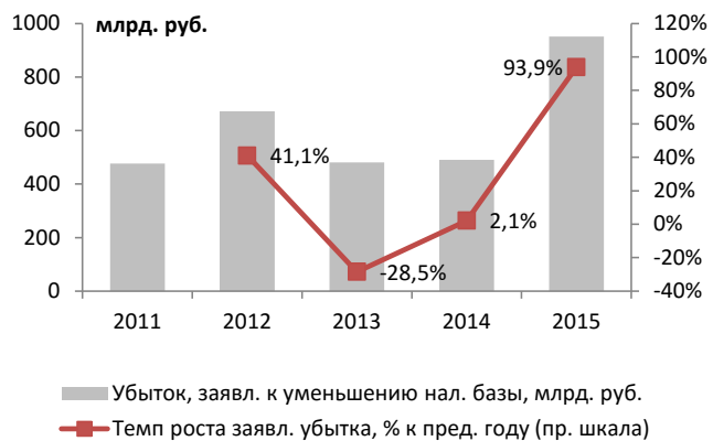
Рис. 1. Сумма убытка, заявленного к уменьшению налоговой базы по налогу на прибыль в 2011-2015 гг.

безотносительно изменений налоговой нагрузки в данных отраслях.