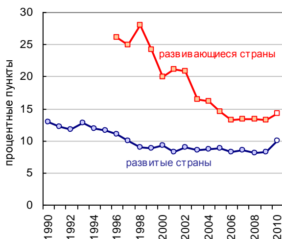
Динамика «индекса невзгод» в развитых и развивающихся странах в 1990-2010 гг.

Примечание: значение индекса за 2009 г. представлено на основе данных за I квартал; данные за 2010 г. представлены на основе прогнозов ОЭСР, МВФ и МОТ