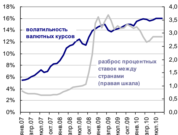
Рисунок 2. Динамика волатильности валютных курсов и разброса процентных ставок между странами

Примечания: волатильность валютных курсов рассчитана как среднеквадратическое отклонение темпов роста номинальных эффективных курсов за последние 12 месяцев; разница процентных ставок рассчитана как отношение среднеквадратического отклонения процентных ставок ведущих мировых экономик к среднему геометрическому процентных ставок, взвешенных по объему ВВП.