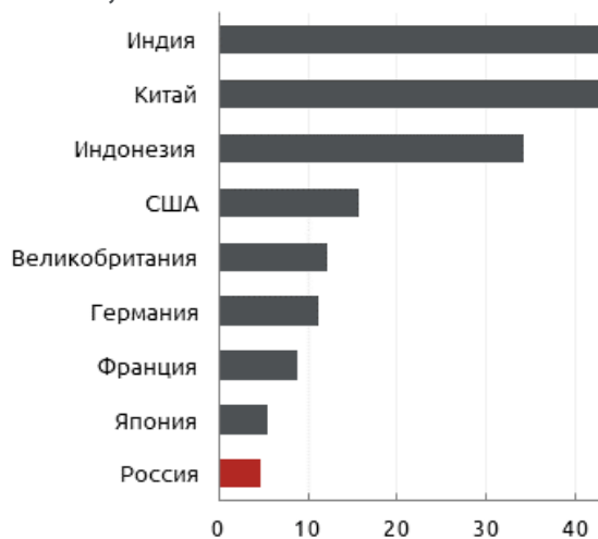
Рис. 3. Рост ВВП отдельных стран в 2019 г. по сравнению с 2013 г., в %

В отчете также отмечаются успехи России в диверсификации экономики : «в период после 2015 г. развитие получили не нефтегазовые сектора». Однако прогресс в области диверсификации заметен только по сравнению с показателями 2015-2016 гг. По сравнению же с 2008 г. роль обрабатывающего сектора в экономике снизилась: если в 2008 г. доля обрабатывающей промышленности в структуре валовой добавленной стоимости составляла 17,5%, то в 2019 г. – уже лишь 14,6% (см. рис. 4).