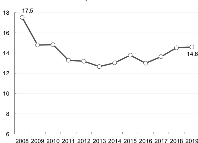
Рис. 4. Доля обрабатывающей промышленности в структуре валовой добавленной стоимости в России в 2008-2019 гг., в %