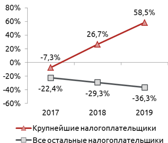
Рис. 1. Изменение количества выездных проверок организаций в 2017-2019 гг. (в % к пред. году)

Изменилась и структура доначислений, осуществляемых налоговиками по итогам выездных проверок. Если в 2017 г. доначисления для крупнейших налогоплательщиков составляли 28,0 млрд. руб. (что соответствовало 9,3% доначислений по стране в целом), то в 2019 г. крупнейшие налогоплательщики по итогам проверок должны выплатить 135,2 млрд. руб., или 45,6% от суммарного объема доначислений. При этом объемы средств, доначисленных по итогам проверок для всех остальных налогоплательщиков, существенно уменьшились (см. рис. 2).