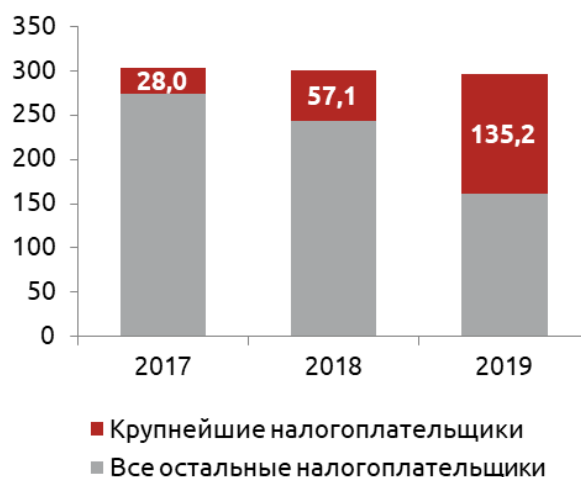
Рис. 2. Объемы доначислений по итогам выездных проверок организаций в 2017-2019 гг. (в млрд. руб.)